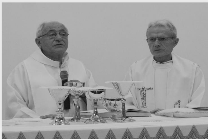
MISSA EM LOUVOR A SANTA JOSEFINA BAKHITA