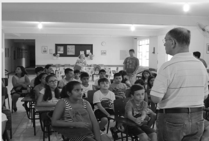
RETORNO DA CATEQUESE INFANTIL