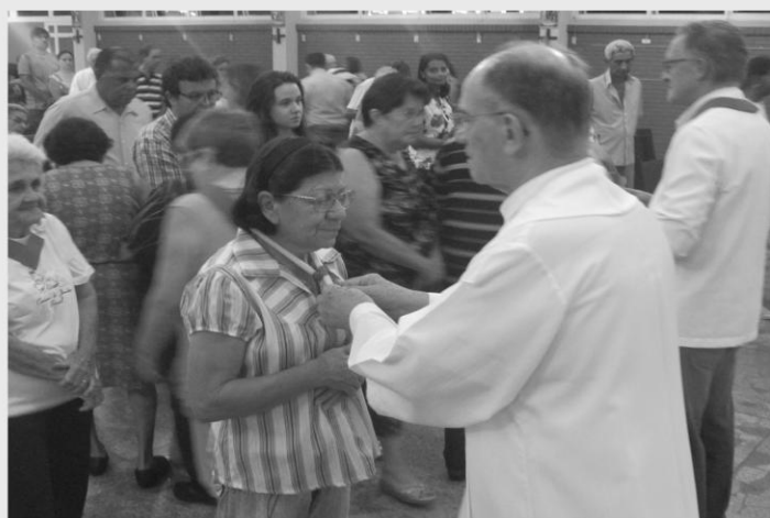
MISSA DE SÃO BRÁS