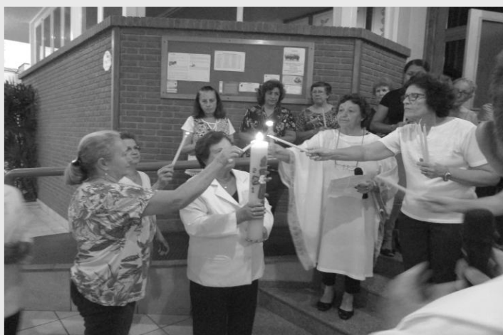
MISSA DA APRESENTAÇÃO DO SENHOR