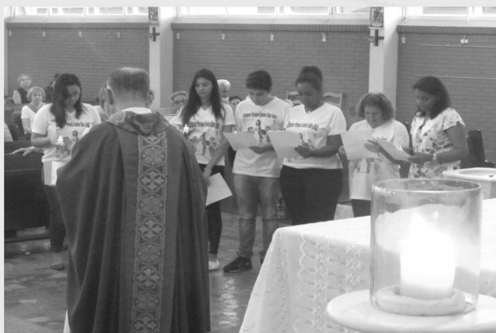
ENVIO DOS CATEQUISTAS