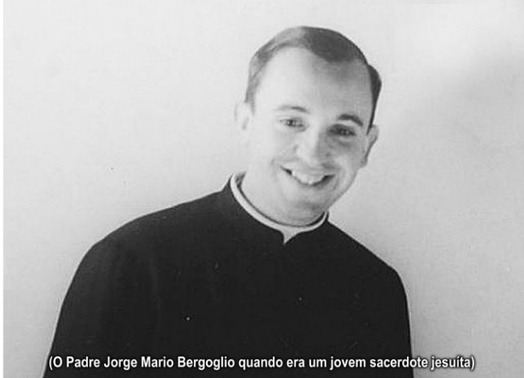
(O Padre Jorge Mario Bergoglio quando era um jovem sacerdote jesuíta)

Jorge nasceu no dia 17 de dezembro de 1936, descende de uma família de imigrantes italianos e foi criado no bairro de Flores, em Buenos Aires. Após abandonar seus estudos na área da Química, ingressou no Seminário de Villa Devoto e em 11 de março de 1958, começou o Noviciado na Ordem dos Jesuítas. Em 1960, obteve a Licenciatura em Filosofia no Colégio Máximo São José, em San Miguel. De 1967 a 1970, cursou Teologia no Colégio Máximo de San Miguel. Foi ordenado Sacerdote no dia 13 de dezembro de 1969, pelas mãos de Dom Ramón José Castellano, após ter perdido parte de um pulmão em decorrência de uma infecção.