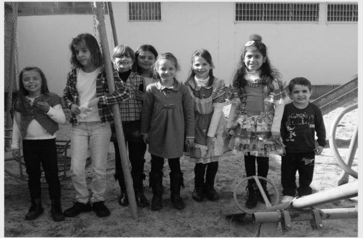
FESTA JUNINA DA CATEQUESE