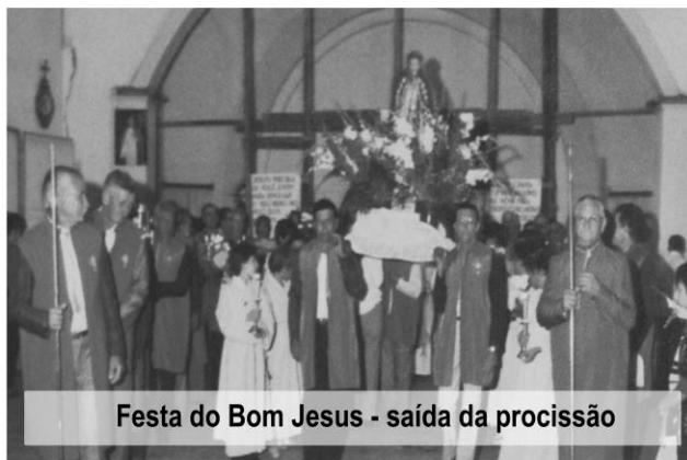
Festa do Bom Jesus - saída da procissão