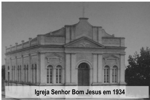
Igreja Senhor Bom Jesus em 1934