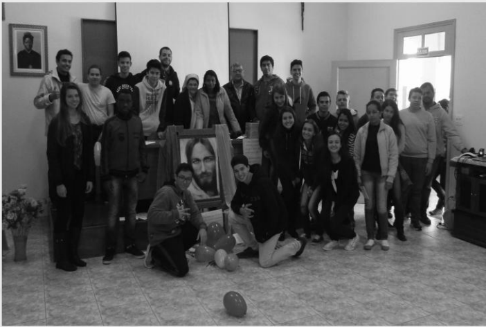
RETIRO DOS CRISMANDOS