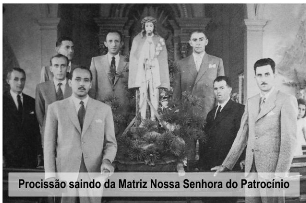
Procissão saindo da Matriz Nossa Senhora do Patrocínio