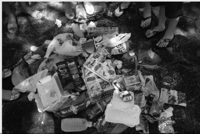
AS CRIANÇAS DA INFÂNCIA E ADOLESCÊNCIA MISSIONÁRIA, FIZERAM UM PEQUENO MUTIRÃO E LIMPARAM A PRACINHA ATRÁS DA IGREJA, ELIMINANDO POSSÍVEIS CRIADOUROS DO MOSQUITO AEDES AEGYPTI