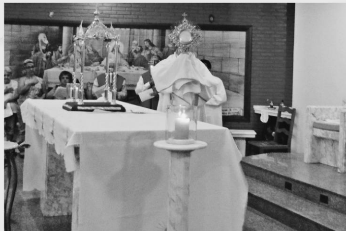
MISSA DE 1 ANO DO TERÇO DOS HOMENS