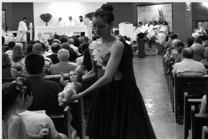
MISSA DA NOITE DE NATAL