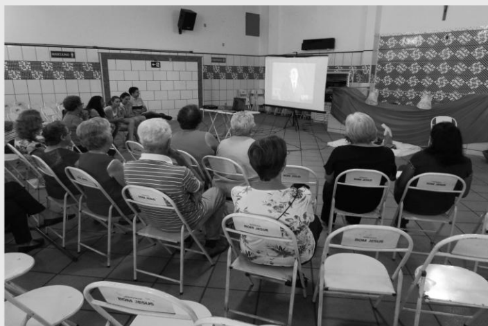
CONFRATERNIZAÇÃO DE PASTORAIS E MOVIMENTOS