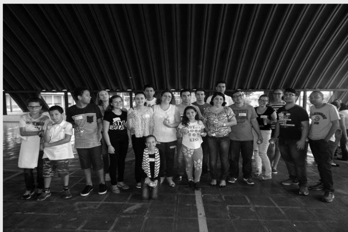
ENCONTRO MUNICIPAL DE COROINHAS E ACÓLITOS