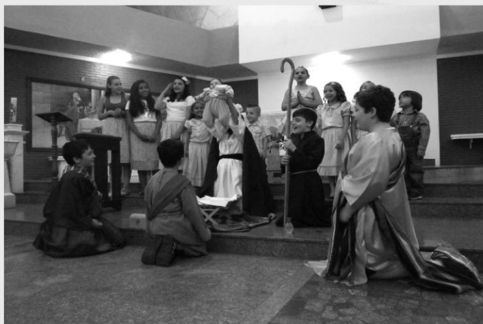
ENCERRAMENTO DA NOVENA DE NATAL