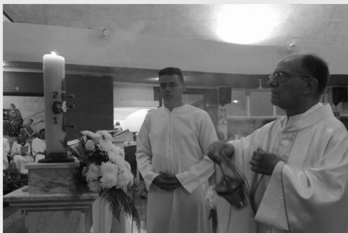
MISSA DO DIA DE NATAL