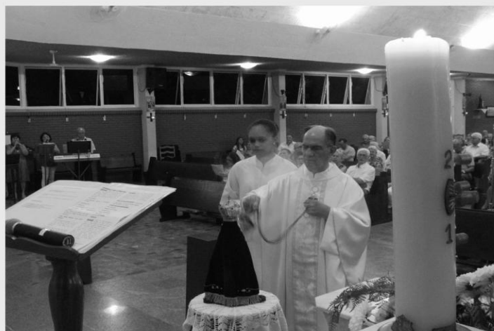
MISSA DA SANTA MÃE DE DEUS