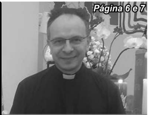
Página 6 e 7

DO PÓ VIEMOS AO PÓ VOLTAREMOS: A QUARTA-FEIRA DE CINZAS