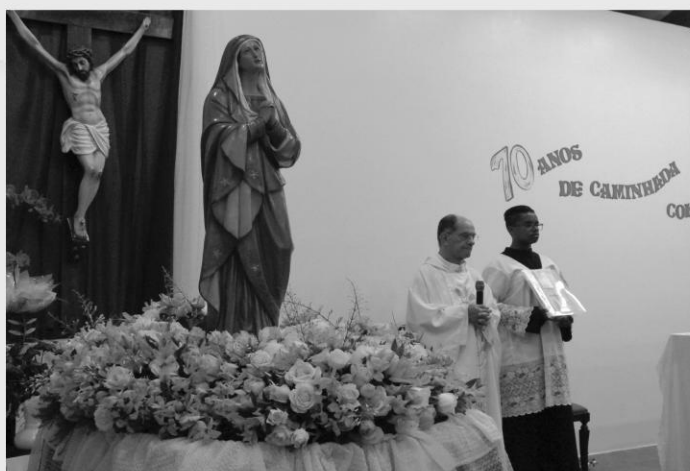
MISSA SOLENE EM LOUVOR A NOSSA SRA. DAS DORES