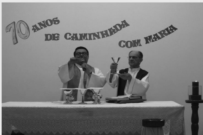
ENCERRAMENTO DAS FESTIVIDADES EM LOUVOR A NOSSA SENHORA DAS DORES