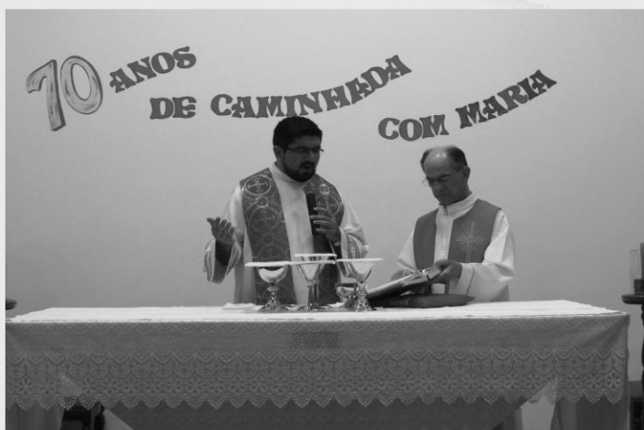
3º DIA DO TRÍDUO - NOSSA SRA. DAS DORES