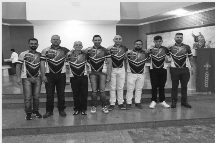
BÊNÇÃO DOS CICLISTAS