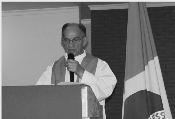
MISSA PELA PÁTRIA